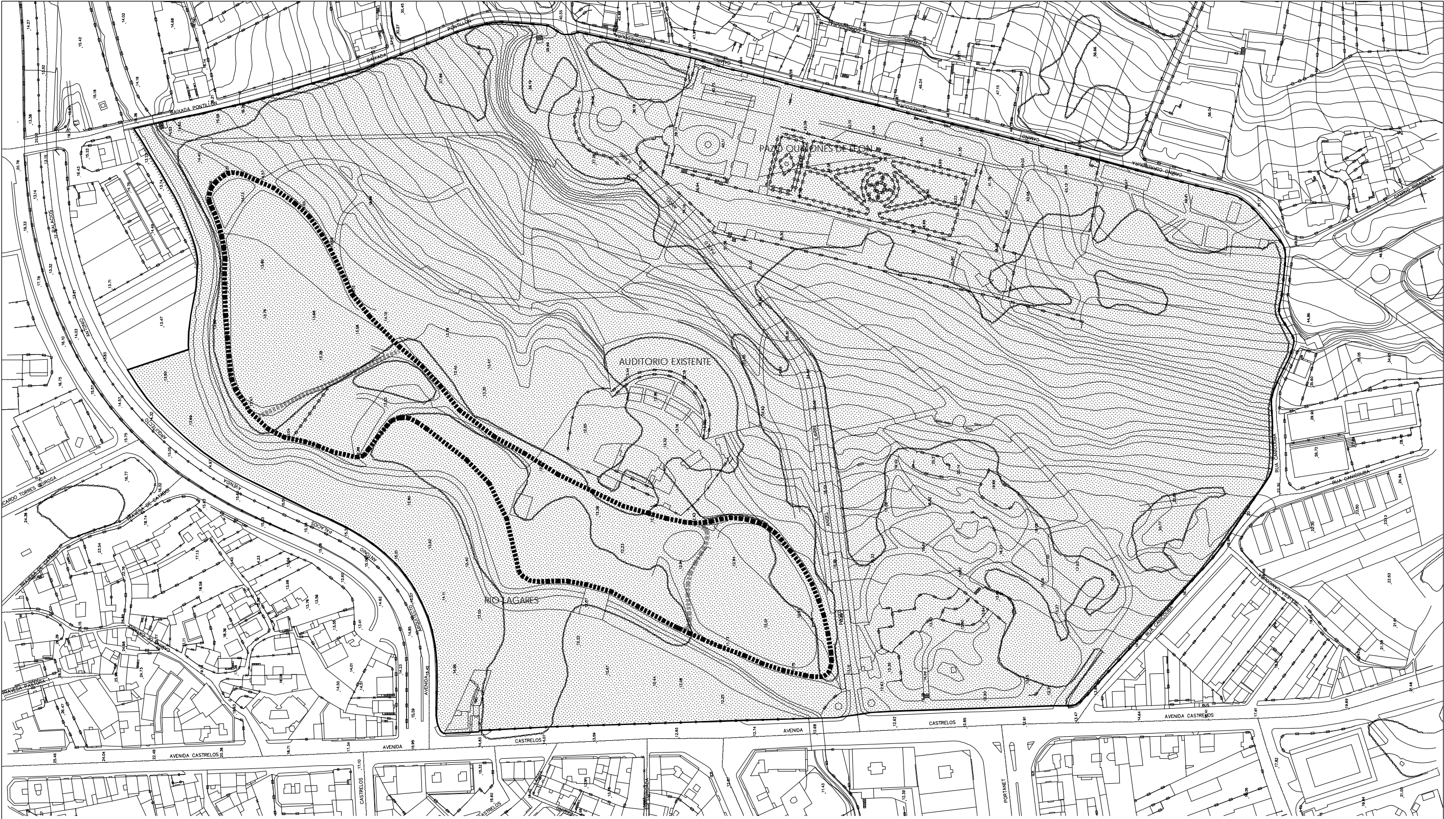
RECORRIDO DE 1200m