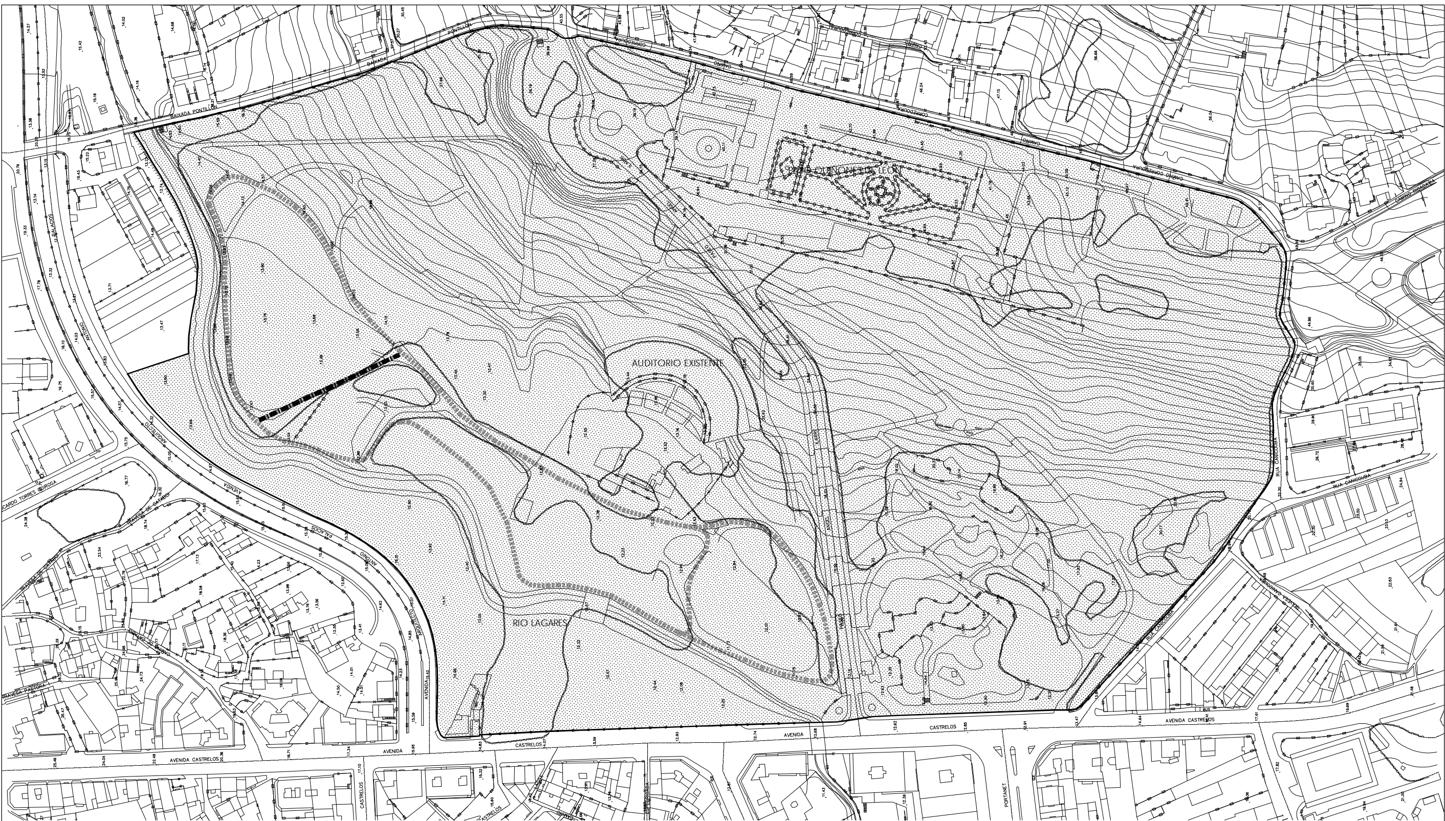
RECTA DE 100m